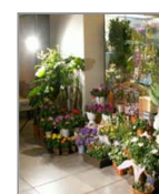
祭事・フラワーショップ

注)消費税は、含まれておりません。注)10台以上の送料は無料(ランプ単品を除く)、10台未満は別途加算致します。 ※台数によりお見積致します。