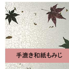
手漉き和紙もみじ