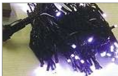
LEDイルミ ホワイト W-LED16IC 100 EGW