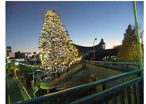
奥に見えるのが代々木体育館です。

クールな狭角ホワイト球を内側に、それを暖かみのある広角ウォームホワイト球(電球色)で包みこみ、約1万個のLEDを使用しています。