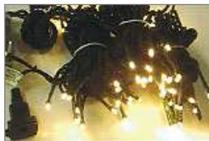
LEDイルミ レモンゴールド W-LED16IC 100 EGC