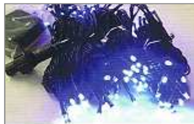
LEDイルミ ブルー W-LED16IC 100 EGB