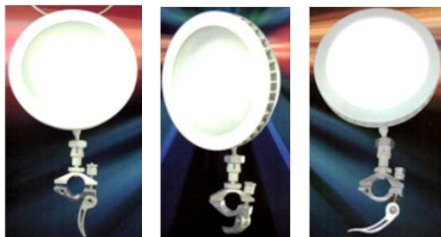
照射方向(上下左右)

車両整備(修理・ピット)工場のボンネット内の作業、工場の確認作業など天井照明では光がとどきづらい場所の照明やエレベーター点検などスペースがない場所の作業に最適です。 適切な場所に取り付けができ、照射方向が上下左右に変えられます。